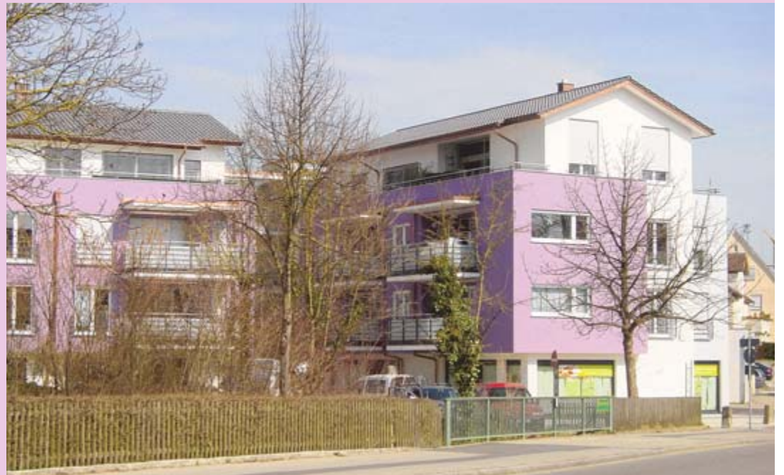
Im Wohn- und Geschäftshaus Meersburger Straße 24 und 24/1 in Friedrichshafen-Fischbach fühlen sich Mieter und Geschäftsleute wohl.

Für Nachhaltigkeit sorgen auch die Massivbauweise mit einem Wärmedämmverbundsystem und die Nutzung von Regenwasser mittels zweier Zisternen.